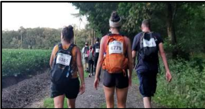
Op stap tijdens de Nacht van Vlaanderen. Afstand 42 kilometer