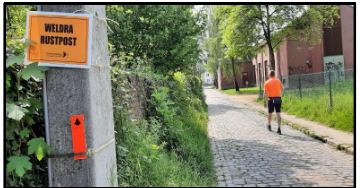
Op stap tijdens de Meerdaal Nature Trail. Afstand 50,770 km - 594 hoogtemeters