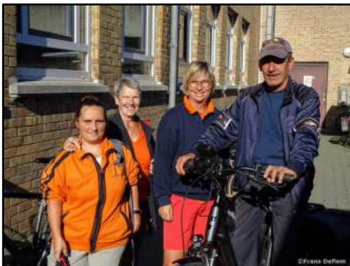
Gespot in Assebroek tijdens de 36e Arsebrouc-tocht