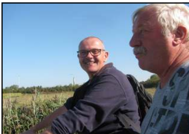
Gespot in Zandvoorde tijdens de Krekentocht