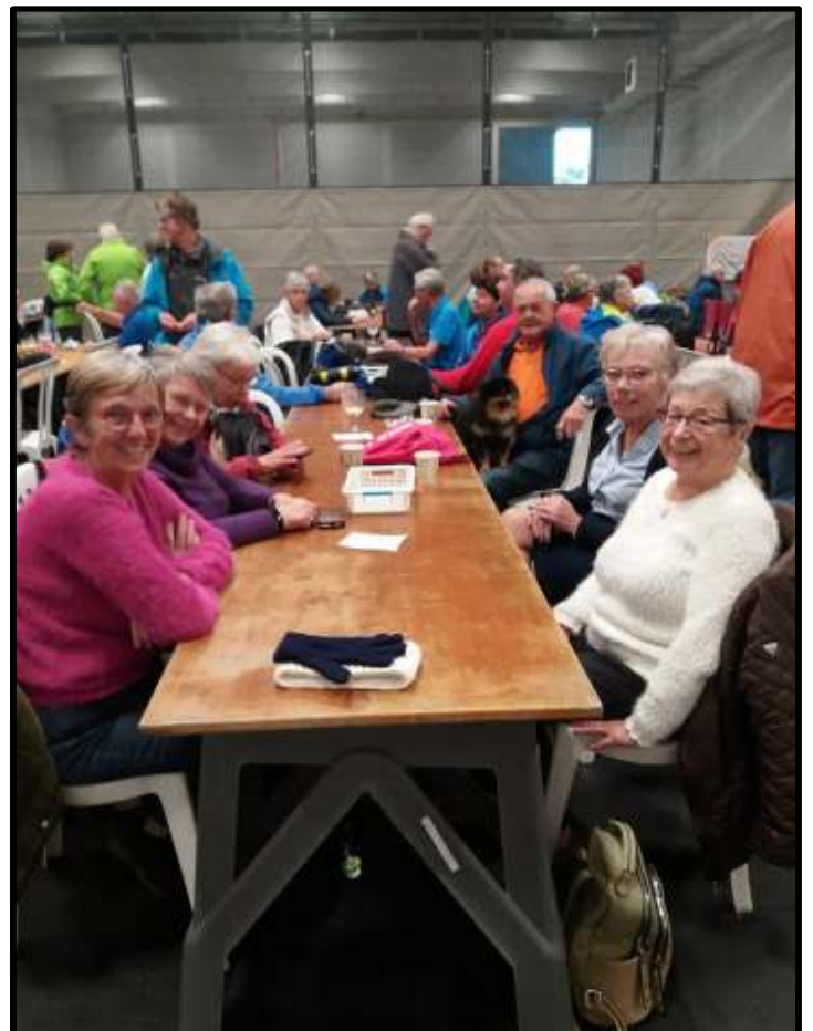
Gespot in Ichtegem tijdens de 14° Sint-Maartenstocht