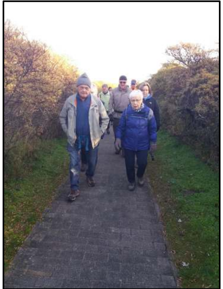
Gespot in Bredene tijdens de 5° Zeebriestocht

Torhoutsesteenweg 46 8400 Oostende Tel 059/702307 info@keurslager-derycker.be