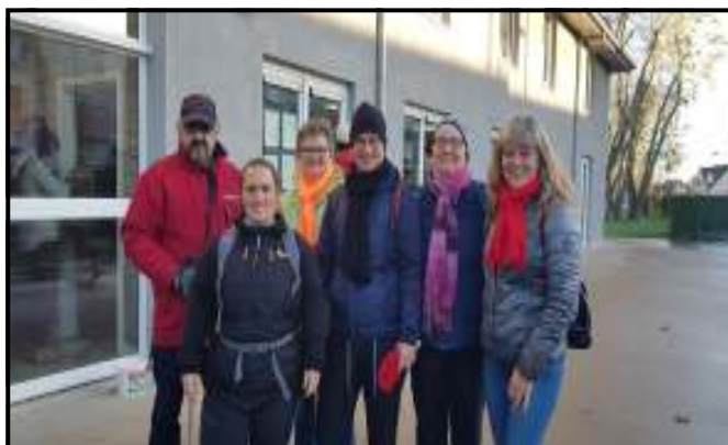
Gespot in Bredene tijdens de 5° Zeebriestocht