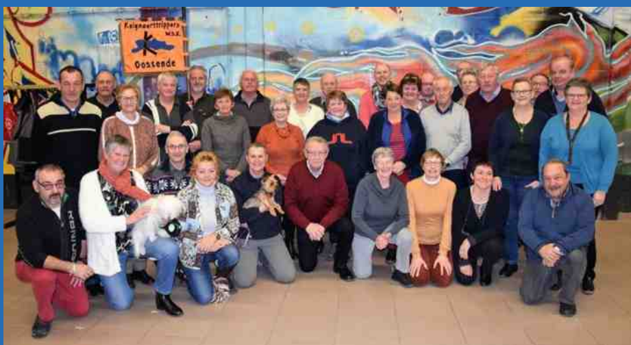
Onze medewerkers 2017

Jaargang 45 april-mei-juni 2018 Nr 2 Driemaandelijks tijdschrift