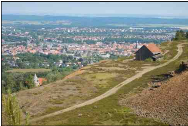
Bijna boven op de Rammelsberg te Goslar.