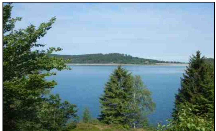
De Granestausee nabij Goslar