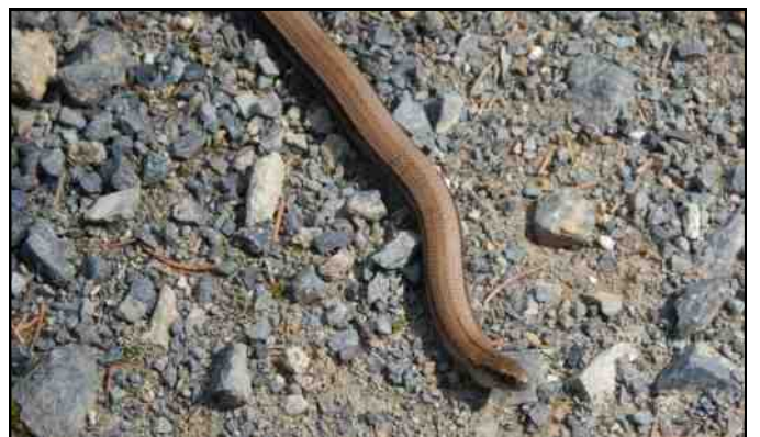
Het gebeurt niet elke dag dat men een adder tegenkomt.