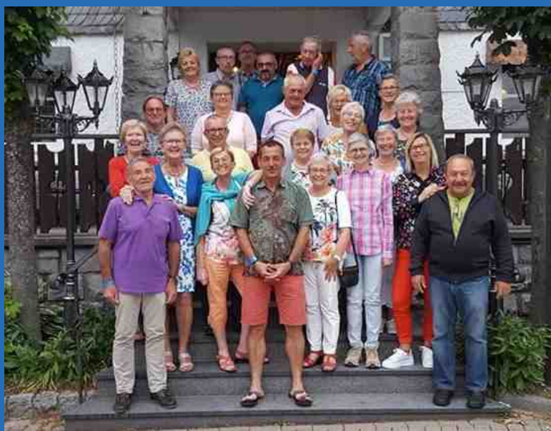
Wandelweek Duitsland 2017

Jaargang 44 juli-augustus-september 2017 Nr 3 Driemaandelijks tijdschrift