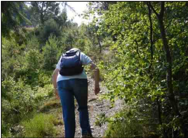
Het laatste maar het zwaarste stuk naar de top van de Rammelsberg.