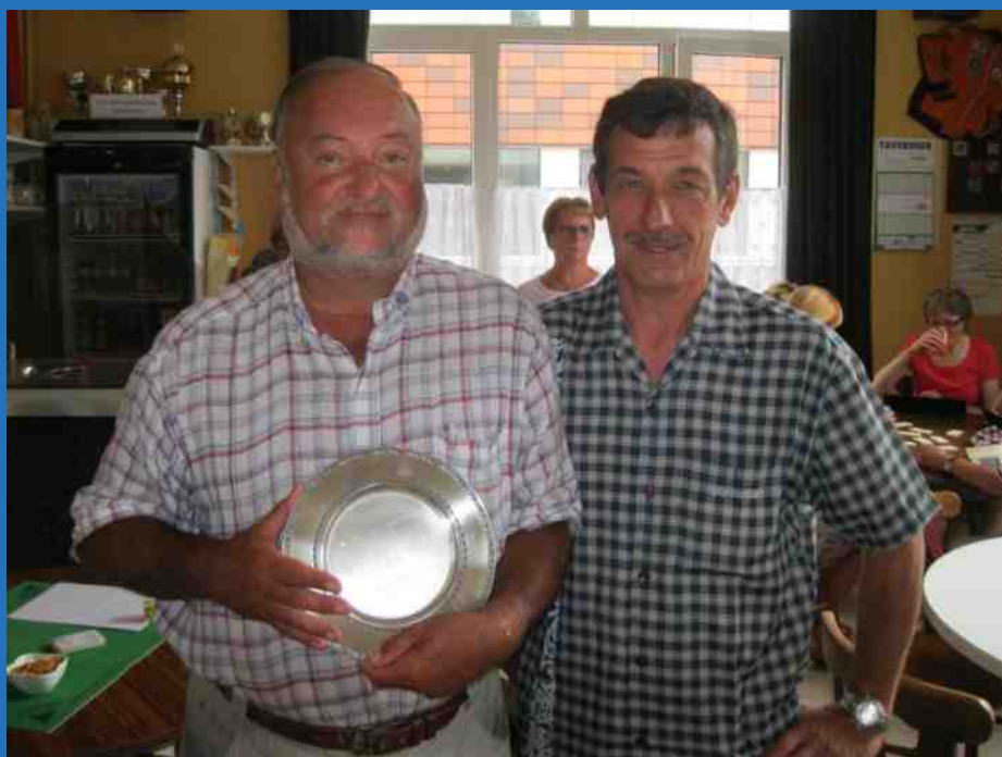
Verdienstelijk lid 2014

Jaargang 41 - oktober - november - december - 2014 Nr 4 Driemaandelijks tijdschrift